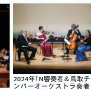
2024年「N響奏者&鳥取チェ ンバーオーケストラ奏者による 琴浦おめでとコンサート」の様子