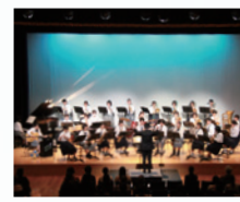
2024年「若美町制 70周年記念コンサート」の様子