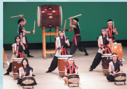
過去の公演の様子

2026年 3月8日(日) | 開演▶14:00 エースバック未来中心 大ホール