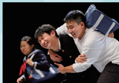
2022年「U-18シアタープロジェクトAct2『捨てきれないもの』より