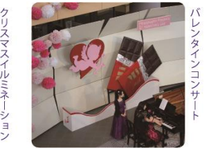
▲コンサートやウィッシュツリーなど来館者が参加できるイベントもありますので、デコレーションと合わせてお楽しみください! (写真は昨年の様子)