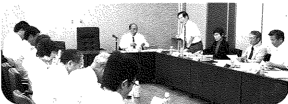
三重県東員町議会(左列)が智頭町議会を視察