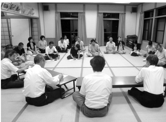
集落自治座談会のようす

これからの地域づくりは「要求型から提案型への転換」を基本に、住民自らが進めたい行動する住民自治を確立することが必要です。そこで、まずは行政が各集落へ出向き、地域が抱える様々な課題・夢・提案などについて話し合う「集落自治座談会」を開催しました。座談会では、まず町長がまちづくりの基本姿勢について話をした後、参加住民と自由に討論する形で行いました。