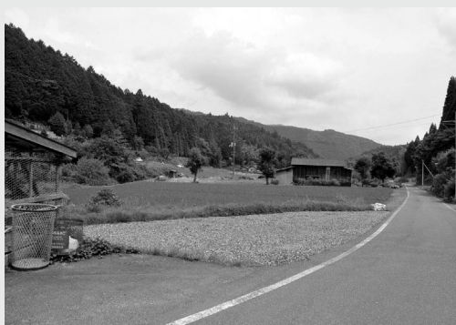
整備された車輛回し場

那岐地区・真鹿野集落で行われた座談会で「集落内に大型車輛の回し場を整備して欲しい」という要望が出ました。集落の人が土地の所有者と交渉し、集落で借地料を負担するという事で用地交渉がまとまり、すぐに町が回し場の整備を行いました。