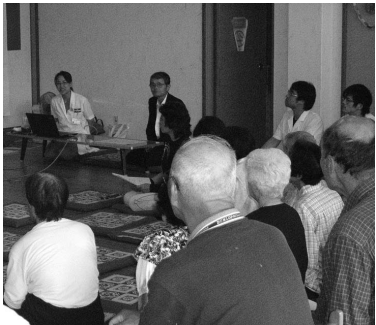
夏場の健康管理講座の様子

医師をはじめ運動指導士 や薬剤師など、職員が地域 へ出向いています。今年も 行いますので、気軽に依頼 してください。