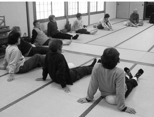
「元気にステップ教室」の様子

近所で誘い合わせて、参加して ください。地域みんなで介護のい らない生活を目指しましょう。