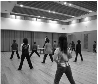
婦人会の皆さんとストレッチ体操

○お知らせ 4月から、診療日程表 が変わります。詳しくは 別途配布チラシをご覧ください。