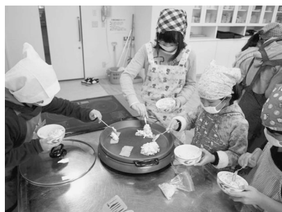
お好み焼き作りの様子

講師は、給食センター調理員のみなさんと、11人の小学生が豆腐やチーズ、お餅を使ったちよっと変わった「お好み焼き」作りに挑戦しました。