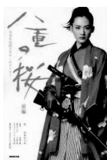
八重の桜 前編 NHK出版