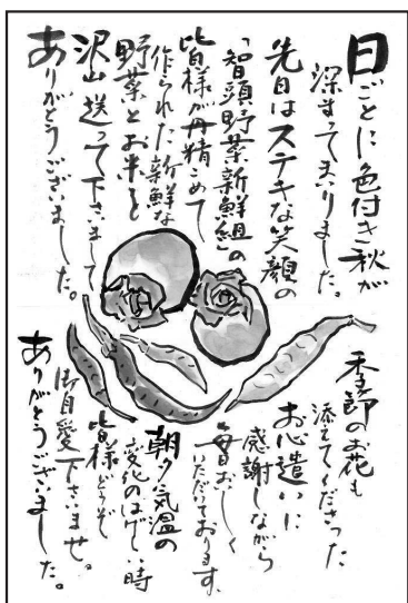
特産品の届いた加入者からこんなステキなお便りが届きました

野菜 ラディッシュ・だいこん・ネギ・ずいき（茎）・一ラ・さといも・甘長とうがらし・かぼちゃ（智頭野菜新鮮組が育てたこだわり野菜）