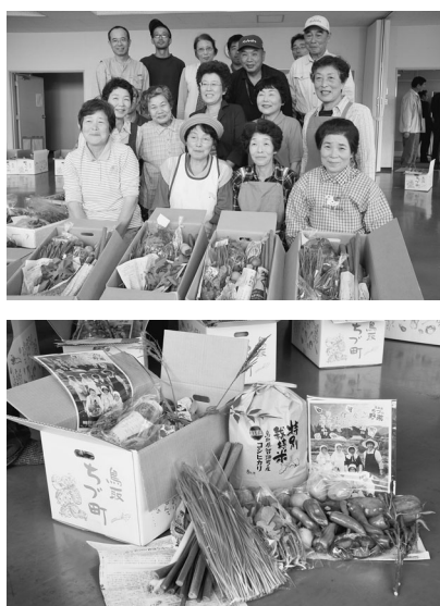
智頭野菜新鮮組の皆さんと特産品

智頭町自慢のこだわりのお米や野菜などの特産品を、10月1日時点の加入者にお届けします。