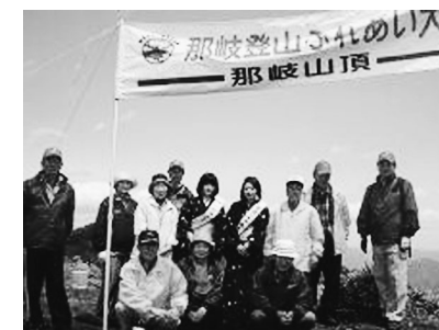
那岐登山ふれあい大会