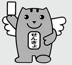
明るい選挙のイメージキャラクター 選挙のめいすいくん

第22回参議院議員通常選挙が7月11日(日)に行われます。 この選挙は国の進路を決める大切な選挙です。候補者や政党の政見・政策などをよく聞き、よく考え、棄権しないよう大切な一票を投じましょう。