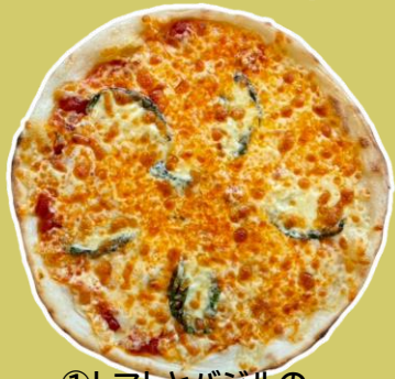
①トマトとバジルの マルゲリータ ¥1,445