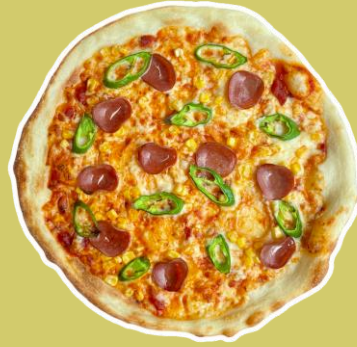
③大山産旬野菜とサラミのピッツァ ¥1,858