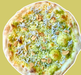
⑥釜揚げしらすとガーリックの ジェノペゼピッツァ ¥1,661