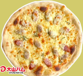
④2種のソーセージと ローズマリーのピッツァ ¥1,563