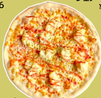
⑧明太子マヨポテトピッツァ ¥1,563