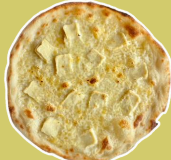
⑤クワトロフォルマッジ (4種チーズ)ピッツァ ¥1,956