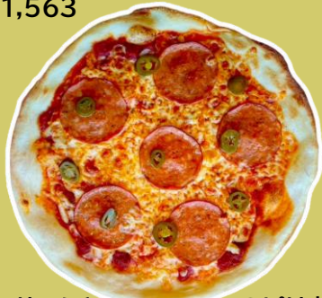
⑦スパイシーサラミとハラパーニョのピリ辛ピッツァ ¥1,858