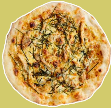
②大山どりの照り焼きピッツァ ¥1,760