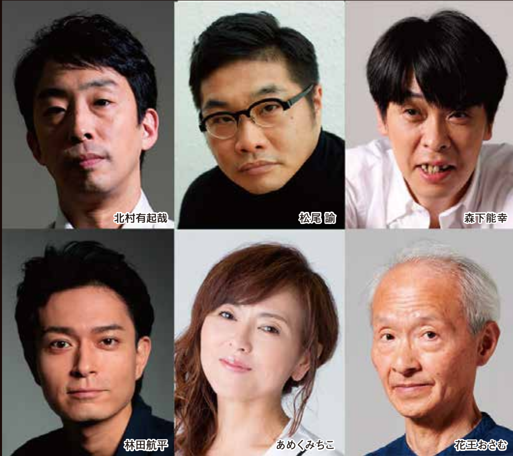
※やむを得ない事情により出演者の変更になる場合がございます。予めご了承ください。