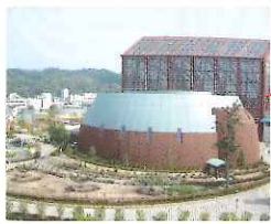
鳥取二十世紀梨記念館(倉吉パークスクエア内)