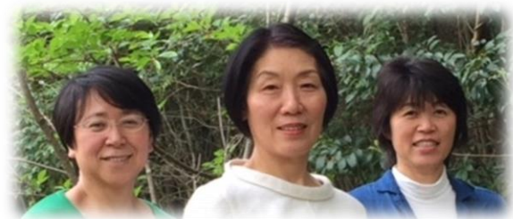
「いのちね」メンバー左から