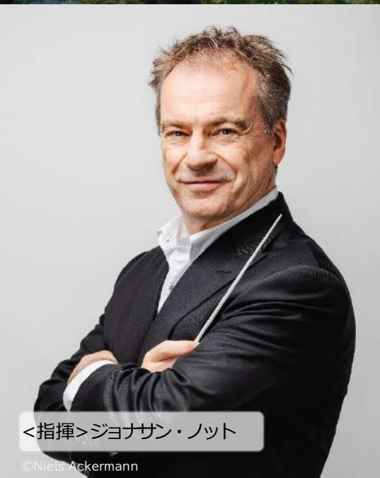
<指揮>ジョナサン・ノット