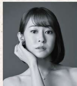
アン・シャーリー役