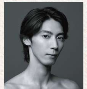
ギルバート・ブライス役