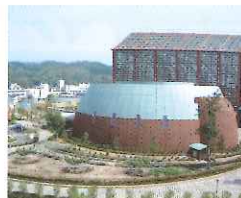
鳥取二十世紀梨記念館 (倉吉パークスクエア内)