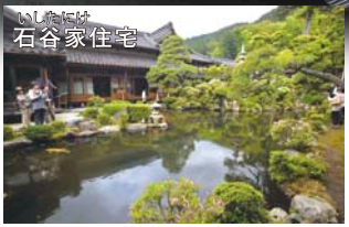
いしやけは 石谷家住宅