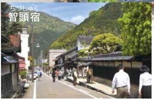
ちつしゅく 智頭宿