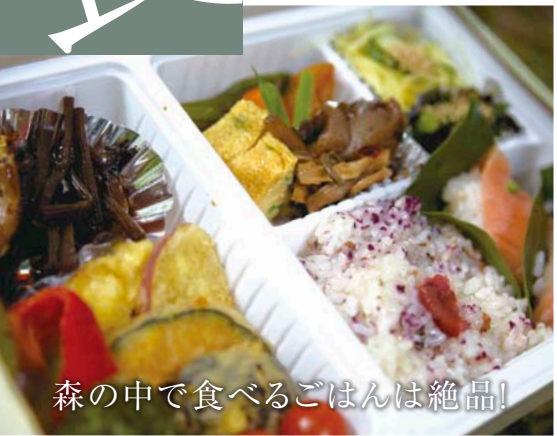
森の中で食べるごはんは絶品!