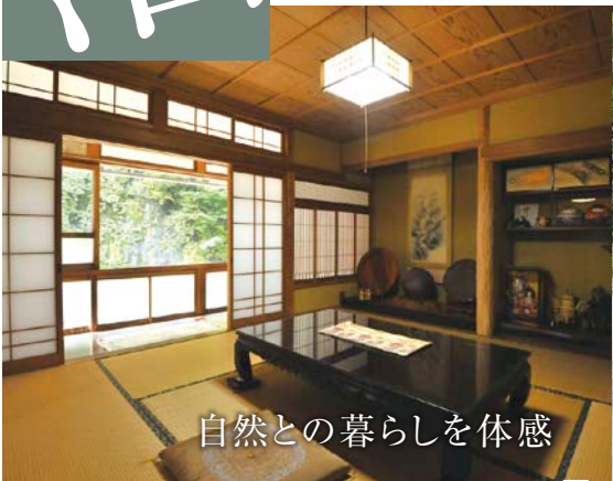
自然との暮らしを体感