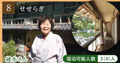
8 せせらぎ 綾木さん 宿泊可能人数 3(4)人

特徴 広縁のある純和風のお家。自家栽培のそば、本場仕込のキムチなど、おもてなしのためにひと工夫されています。 家族構成 ご主人、奥さん お仕事 ご主人：元運転手 ひとこと 自然の恵みと芦津の森のお話