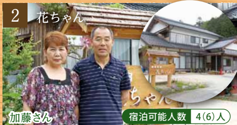
2 花ちゃん 宿泊可能人数 4(6)人

特徴 智頭の木たっぷりのお宅。お話好きなご主人、奥さんと息子さんご夫婦、お孫さんと3世代でおもてなし。 家族構成 ご主人、奥さん、ご長男夫婦、お孫さん2人 お仕事 製材業 ひとこと 町内の杉林の散策のご案内も