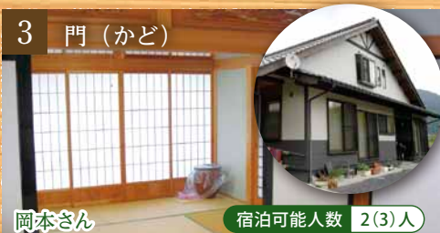
3 門(かど) 岡本さん 宿泊可能人数 2(3)人

特徴 大きな薪ストーブのある吹抜けの空間が居心地良く、コレクションの陶器で美味しいお茶の時間も楽しめます。 家族構成 ご主人、奥さん、おじいさん、ペット(猫) お仕事 ご主人：会社員、奥さん：畑づくり ひとこと 畑で採れたて野菜と手づくり料理、ご主人の登山の話