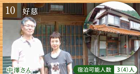
10 好慈 中澤さん 宿泊可能人数 3(4)人

特徴 里山風景が美しい波多集落にあるお家。じげの味・柿の葉ずしや鳥取ならではの食材でお話が尽きないとのこと。 家族構成 ご主人、奥さん、ご次男夫婦、お孫さん2人 お仕事 ご主人：自営業、奥さん：役場職員 ひとこと 記念写真を撮ってアルバムにしておられます