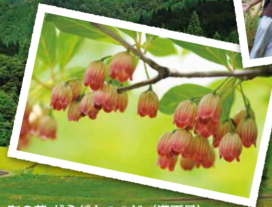
町の花 どうだんつつじ（満天星）