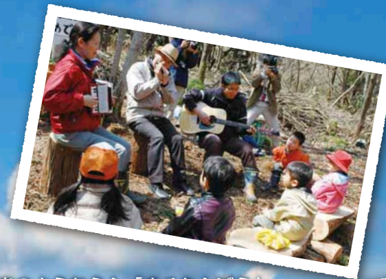
森のようちえん「まるたんぼう」